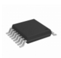
NLV74HC157ADTR2G ON Semiconductor IC DECODER/DEMUX DUAL 16TSSOP