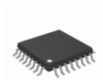
AD5764ASUZ Analog Devices Inc. IC DAC 16BIT QUAD VOUT 32-TQFP