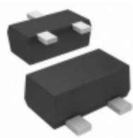
CMUT5179 TR Central Semiconductor Corp TRANS NPN 20V 50MA SOT523