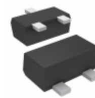
CMUT2907A BK Central Semiconductor Corp TRANS PNP 60V 0.6A SOT523