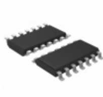
ATTINY214-SSFR Micrel / Microchip Technology 125CGREEN 20MHZ SOIC14