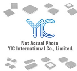
ATTINY22L-4SI ATMEL ATMEL SOP-8