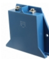
B80K385 EPCOS (TDK) VARISTOR 620V 100KA CHASSIS