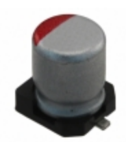
RFS1A100MCN1GB Nichicon CAP ALUM POLY 10UF 20% 10V SMD