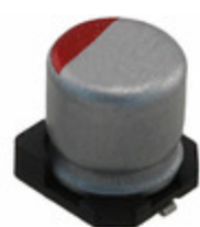
RFS1C220MCN1GS Nichicon CAP ALUM POLY 22UF 20% 16V SMD