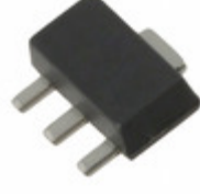
SKY65013-70LF Skyworks Solutions Inc. IC INGAP AMP 7GHZ SOT-89