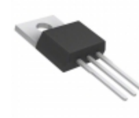
D44H11TU Fairchild/ON Semiconductor TRANS NPN 80V 10A TO-220