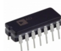
AD594AQ Analog Devices Inc. IC THERMOCOUPLE A W/COMP 14CDIP