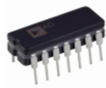
AD594CQ Analog Devices Inc. IC THERMOCOUPLE A W/COMP 14CDIP