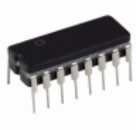
AD7249SQ Analog Devices Inc. IC DAC 12BIT SRL W/REF 16-CDIP