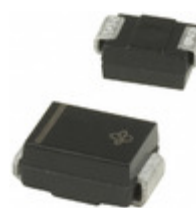
SMBJ54A-E3/52 Vishay Semiconductor Diodes Division TVS DIODE 54VWM 87.1VC SMB