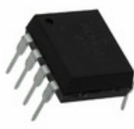
HCNR201-050E Broadcom Limited OPTOISO 5KV LINEAR PHVOLT 8DIP