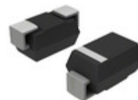
SMBJ200CE3/TR13 Microsemi Corporation TVS DIODE 200VWM SMBJ