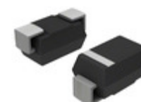
SMBJ200CAE3/TR13 Microsemi Corporation TVS DIODE 200VWM SMBJ