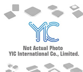
MIC69501-1.5WR MICREL MIC69501-1.5WR MICREL