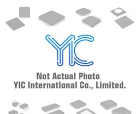
MIC69501-1.2WR MICREL MIC69501-1.2WR MICREL