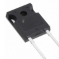
RURG3060_F085 Fairchild/ON Semiconductor DIODE GEN PURP 600V 30A TO247-2