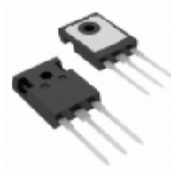
RURG3020CC Fairchild/ON Semiconductor DIODE ARRAY GP 200V 30A TO247