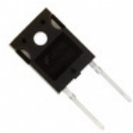
RURG3060 Fairchild/ON Semiconductor DIODE GEN PURP 600V 30A TO247