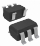
LP2985A-29DBVTG4 N/A IC REG LDO 2.9V 0.15A SOT23-5