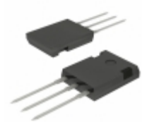
MBR3090PT C0G TSC (Taiwan Semiconductor) DIODE ARRAY SCHOTTKY 90V TO247AD