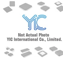
MBR3090PT GS MBR3090PT GS