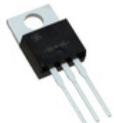
MBR3090CTHC0G TSC (Taiwan Semiconductor) DIODE ARRAY SCHOTTKY 90V TO220AB