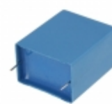
B32794D3805K EPCOS (TDK) CAP FILM 8UF 10% 700VDC RADIAL