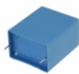
B32794D4225K EPCOS (TDK) CAP FILM 2.2UF 10% 1.05KVDC RAD