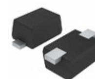
EDZVT2R13B Rohm Semiconductor DIODE ZENER 13V 150MW EMD2