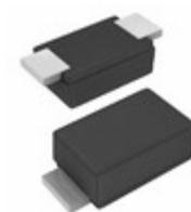
SE10FJ-M3/I Electro-Films (EFI) / Vishay DIODE GEN PURP 600V 1A DO219AB