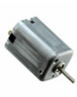
SE10G0UTMAF NMB Technologies Corp. BRUSH MOTOR DC 10MM X 15MM