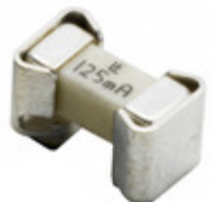
0157004.DRT Littelfuse Inc. FUSE BRD MNT 4A 125VAC/VDC 2SMD