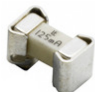
0157003.DR Littelfuse Inc. FUSE BOARD MNT 3A 125VAC/VDC SMD