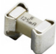
0157002.DRT Littelfuse Inc. FUSE BOARD MNT 2A 125VAC/VDC SMD