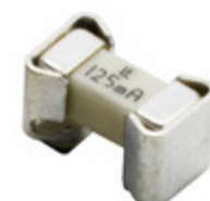
0157007.DR Littelfuse Inc. FUSE BRD MNT 7A 125VAC/VDC 2SMD