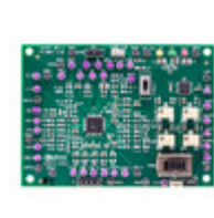
AD8452-EVALZ ADI (Analog Devices, Inc.) ANALOG FRONT END