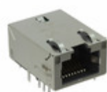
A829-1J1T-KM Bel MAGJACK 1P 1GBT AUTO ETHERNET