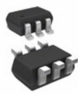
CMKT3920 TR Central Semiconductor Corp TRANS 2NPN 60V 0.2A SOT363