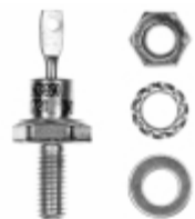
VS-1N3890 Vishay Semiconductor Diodes Division DIODE GEN PURP 100V 12A DO203AA