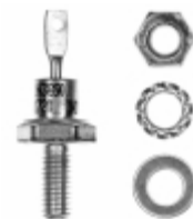
VS-1N3890 Vishay Semiconductor Diodes Division DIODE GEN PURP 100V 12A DO203AA