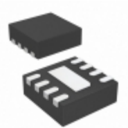
LT3060IDC-5#TRMPBF ADI (Analog Devices, Inc.) IC REG LINEAR 5V 100MA 8DFN