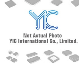
74VHCT00SJX SOP5.2 FAIRCHILD FAIRCHILD SOP14-5.2MM