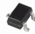
ADM1818-R22AKS-RL7 Analog Devices Inc. IC MONITOR RESET 2.18V SC-70-3