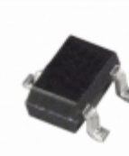
ADM1818-R22AKSZ-R7 Analog Devices Inc. IC MONITOR RESET 2.18V SC-70-3