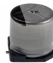
EEE-TK1V221UP Panasonic Electronic Components CAP ALUM 220UF 20% 35V SMD