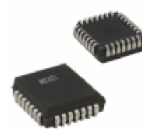
MIC5801YV Microchip Technology IC DRVR LATCH 8BIT PAR IN 28PLCC