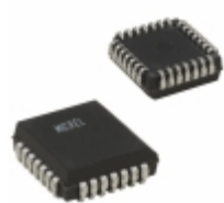
MIC5801YV-TR Microchip Technology IC DRVR LATCH 8BIT PAR IN 28PLCC