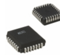
MIC5801BV TR Microchip Technology IC DRVR LATCH 8BIT PAR IN 28PLCC