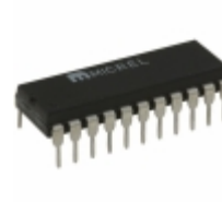
MIC5801BN Microchip Technology IC DRVR LATCH 8BIT PAR IN 22DIP