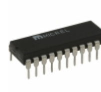
MIC5801YN Microchip Technology IC DRVR LATCH 8BIT PAR IN 22DIP