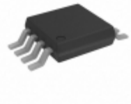
AD8510ARMZ-REEL Analog Devices Inc. IC OPAMP JFET 8MHZ 8MSOP