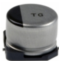
EEV-TG1A221UP Panasonic Electronic Components CAP ALUM 220UF 20% 10V SMD