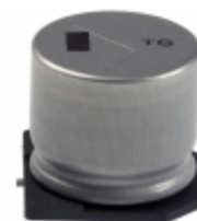
EEV-TG1A472M Panasonic Electronic Components CAP ALUM 4700UF 20% 10V SMD