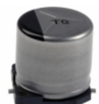
EEV-TG1A471UP Panasonic Electronic Components CAP ALUM 470UF 20% 10V SMD