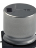
EEV-TG1A222M Panasonic Electronic Components CAP ALUM 2200UF 20% 10V SMD