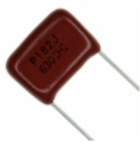
ECQ-P6182JU Panasonic Electronic Components CAP FILM 1800PF 5% 630VDC RADIAL