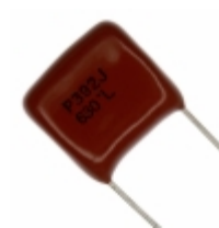
ECQ-P6392JU Panasonic Electronic Components CAP FILM 3900PF 5% 630VDC RADIAL