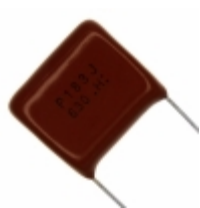
ECQ-P6183JU Panasonic Electronic Components CAP FILM 0.018UF 5% 630VDC RAD