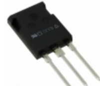
IXKR47N60C5 IXYS MOSFET N-CH 600V 47A ISOPLUS247