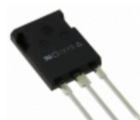
IXKR40N60C IXYS MOSFET N-CH 600V 38A ISOPLUS247