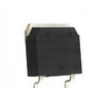
IXKT70N60C5 IXYS MOSFET P-CH 600V 68A TO-268