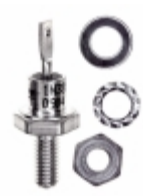
VS-1N3881 Vishay Semiconductor Diodes Division DIODE GEN PURP 200V 6A DO203AA