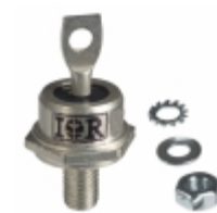
VS-1N3768R Electro-Films (EFI) / Vishay DIODE GEN PURP 1KV 35A DO203AB