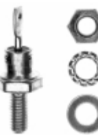
VS-1N3879 Vishay Semiconductor Diodes Division DIODE GEN PURP 50V 6A DO203AA