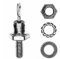
VS-1N3880 Vishay Semiconductor Diodes Division DIODE GEN PURP 100V 6A DO203AA