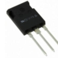
DSEP30-12CR IXYS DIODE GEN 1.2KV 30A ISOPLUS247