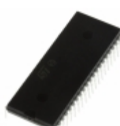
TDA7429S STMicroelectronics IC PROCESSOR AUDIO DGTL 42- SDIP