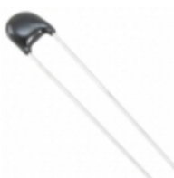
ERZ-E05A201 Panasonic Electronic Components VARISTOR 200V 1.2KA DISC 7MM