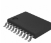
MC908QC8MDSE NXP USA Inc. IC MCU 8BIT 8KB FLASH 20TSSOP