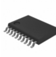
MC908QC8VDSE NXP USA Inc. IC MCU 8BIT 8KB FLASH 20TSSOP