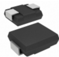
ERZ-SF2MK270 Panasonic Electronic Components VARISTOR 27V 125A 2SMD JLEAD