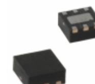
MIC5305-2.6YML-TR Microchip Technology IC REG LDO 2.6V 0.15A 6MLF