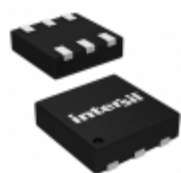
ISL9021IRU3Z-T Intersil IC REG LDO 1.3V 0.25A 6UTDFN