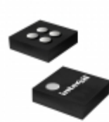
ISL9021IIWZ-T Intersil IC REG LDO 1.2V 0.25A 4WLCSP