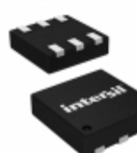
ISL9021IRUBZ-T Intersil IC REG LDO 1.5V 0.25A 6UTDFN