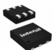
ISL9021IRUCZ-T Intersil IC REG LDO 1.8V 0.25A 6UTDFN