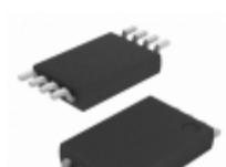
CAT25128YI-G ON Semiconductor IC EEPROM 128KBIT 10MHZ 8TSSOP