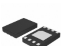
CAT25160HU2I-GT3 ON Semiconductor IC EEPROM 16KBIT 10MHZ 8UDFN