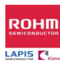
MTZJT-725.6B/5.6V ROHM MTZJT-725.6B/5.6V ROHM