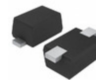
EDZVFHT2R30B LAPIS Semiconductor ZENER DIODES (CORRESPONDS TO AEC)