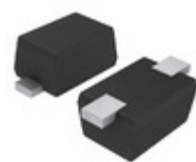
EDZVFHT2R6.8B LAPIS Semiconductor ZENER DIODES (CORRESPONDS TO AEC)