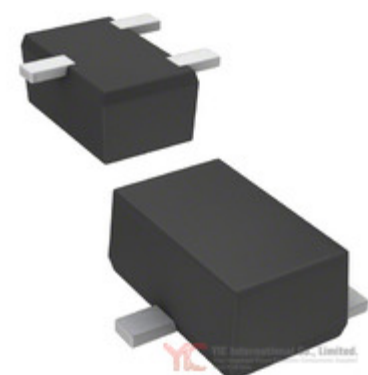
Image may be representation. See specs for product details.