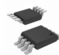
SI6981DQ-T1-GE3 Electro-Films (EFI) / Vishay MOSFET 2P-CH 20V 4.1A 8-TSSOP