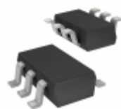
CDSOT236-DSL0312 Bourns Inc. TVS DIODE 12VWM 34VC SOT23-6