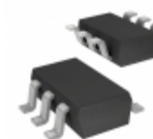
CDSOT236-0504LC Bourns Inc. TVS DIODE 5VWM 8.1VC SOT23-6