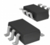
CDSOT236-0504C Bourns Inc. TVS DIODE 5VWM 10VC SOT23-6