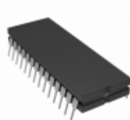
AD7878BQ Analog Devices Inc. IC ADC 12BIT W/DSP INT 28- CDIP