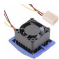
FHP27-27-20/T710/M CTS Electronic Components FAN AXIAL 26.6X20.9MM 5VDC 2510